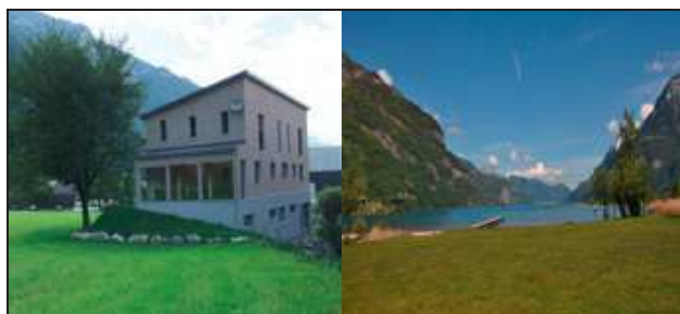
Haus Carmen Seedorf

Auf dem Haldi logieren wir im Skihaus und können eine tolle Aussicht geniessen. Die Anreise mit der Luftseilbahn und dem Spaziergang zum Skihaus bietet bereits das erste Wochenend-Erlebnis. Eine Wurst bräteln und die Natur geniessen gehört auch dazu und wird mit Spiel und Spass abgerundet.